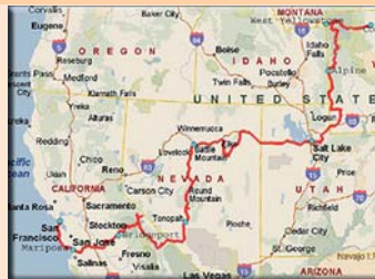
Wild West Yellowstone Touren-Karte

Yellowstone Nationalpark ist einer der berühmtesten und eindrucklichsten Naturgebiete der USA voller dampfender, farbiger Heisswasserquellen und faszinierender Mineralablagerungen. Auf Wanderwegen begegnen Sie hier den ungewöhnlichsten Landschaften. Von sicheren Aussichtsplattformen aus können Sie die vulkanischen Naturphänomene beobachten und fotografieren. Ein ganz anderes Naturerlebnis bieten der berühmte Yosemite National Park und der weniger bekannte, doch nicht minder faszinierende Great Basin National Park mit Tropfsteinhöhle und über 4500 Jahre alten Bäumen, den Bristlecone Pines.