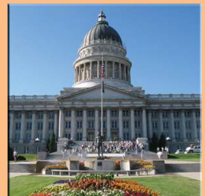
Salt Lake City Capitol