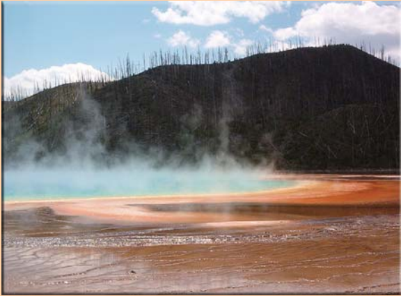
Yellowstone National Park

14 Tage / 13 Nächte von San Francisco, Kalifornien nach Cody, Wyoming