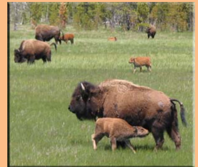
Wilde Büffel Herde

Ein Besuch in dieser Gegend ist nicht komplett ohne sich in die Geschichte und Kunst des Wilden Westens, der Cowboys, Indianer und Goldsucher zu vertiefen. Auf dieser Tour werden Sie vieles erleben, das Ihnen die Besiedlung des weiten Westens erklären wird. Wir besuchen das Hinterland von Nevada mit seinen vielen Geissterstädten, die einstmals von Tausenden von abenteuerlichen Gold- und Silbersuchern bewohnt waren. Tonopah ist bekannt als die Nummer Eins für Sternbeobachtung dank der geringen Lichtverschmutzung und bietet ein einmaliges Erlebnis.