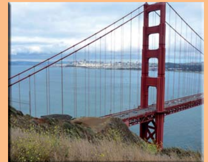
Golden Gate Bridge - San Francisco