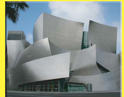
Walt Disney Concert Hall, Los Angeles