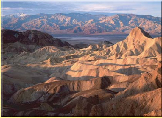
Death Valley National Park, Kalifornien