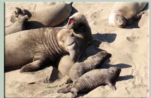
See-Elefanten bei San Simeon