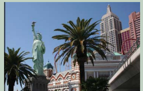
Las Vegas Strip