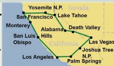
Karte der Kalifornien Rundreise

Erleben Sie den Kontrast zwischen Natur und Kultur auf dieser Reise im Herzen von Kalifornien. Lichter und belebte Strassen in San Francisco und Los Angeles. In Monterey und Big Sur die naturbelassenen Strände, gewaltigen Wälder und National Parks, diese Rundreise lässt Sie die grosse Vielfalt an Schönheiten dieses Staates kennenlernen.