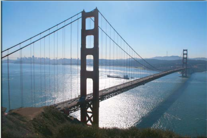
Golden Gate Brücke, im Hintergrund San Francisco