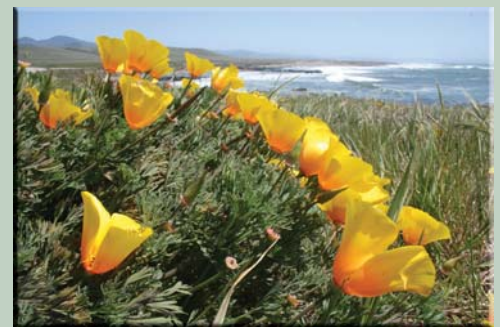
Küste von Big Sur

Shoppen, Galerien, Fischerhafen-Romantik, Las Vegas Lichtermeer und Nachtleben stehen im Kontrast zu friedlichen Wanderungen entlang der schönen, einsamen Pazifik Küste und durch die weiten Landschaften im Joshua Tree und Death Valley Nationalpark. Der Anblick des Mono Lake Sees mit seinen bizarren Tufa Steintürmen, im Hintergrund die schneebedeckten Sierra Nevada Berggipfel und die Alabama Hills, wo viele Wild-westfilme gedreht werden runden das Naturerlebnis ab.