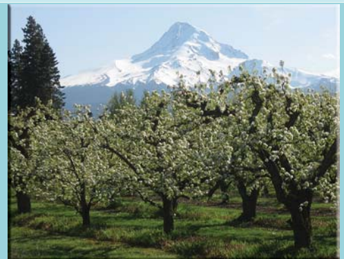
Mt. Hood und Obstplantage

Oregon's Kaskaden Gebirge besteht aus aktiven Vulkanen. Lava bedeckt einen grossen Teil der Hochprarie. Auf dieser Rundreise haben Sie Gelegenheit, den berühmten Crater Lake National Park zu besuchen, wo ein gewaltiger Vulkan vor rund 8000 Jahren ausbrach und den tiefsten See der USA hinterliess. In Zentral-Oregon liegt die moderne Stadt Bend, umgeben von Lava Gebiet, wo seltenes Vulkanglass zu sehen ist. Auch Mount Hood gehört zu den Feuer-ring Vulkanen und hat eine ganzjährig schneebedeckte Kuppe, wo auch im Sommer Snowboarden gross geschrieben wird.