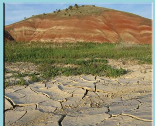
Farbige Landschaft, Fossil Beds N.M.