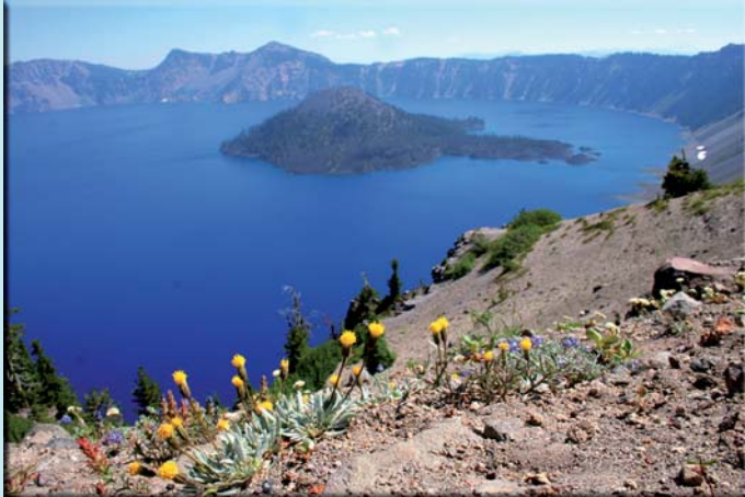
Crater Lake National Park