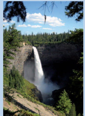
Wells Gray Park