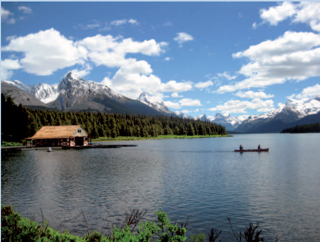
Kanufahrt auf dem Maligne Lake