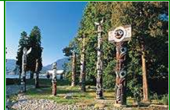
Stanley Park, Vancouver

Heute erkunden wir weitere Teile der Sunshine Coast, verträumte Fischer- und Künstlerdörfer und wandern durch tief mit Moosen behangenen Urwald. Die Fährenfahrt zwischen Landale und North Vancouver zwischen einsamen, kleinen Inseln gehört zu den Höhepunkten. Wir besuchen den berühmten Stanley Park in Vancouver, von wo aus man eine wunderbare Aussicht auf die Stadt genießt. Ein Besuch des Fort Langley, historischer Standort der Hudson's Bay Company und Geburtsort von British Columbia bietet viel Historisches. Uebernachtung in Langley.