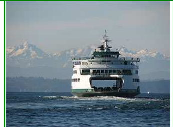
Bainbridge Fähre zur Olympic Peninsula

Heute fahren wir mit der Autofähre hinüber auf die Halbinsel des Olympic Nationalparks. Wenn es das Wetter erlaubt, erkunden wir die Bergwelt mit schneebedeckten Gipfeln und fantastischem Ausblick auf einer kleine Wanderung hoch oben auf dem Hurricane Ridge. Den Abend verbringen wir auf Meereshöhe in Port Angeles.