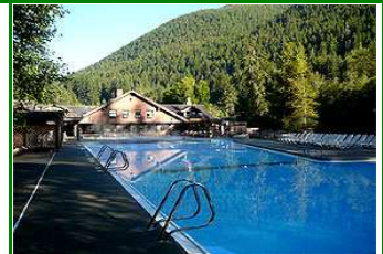
Sol Duc Mineralbäder

Wir erkunden den Olympic National Park, wandern an der Pazifikküste entlang, erkunden den Regenwald und genießen ein gesundes Bad in den Sol Duc Hot Springs.. Abends gelangen wir mit der Fähre in die sehenswerte Hauptstadt von British Columbia, Victoria. Zwei Uebernachtungen in Victoria.