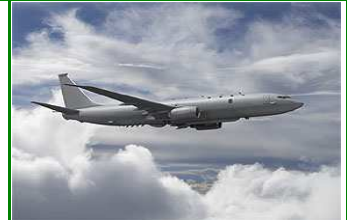
Ankunft in Seattle

Willkommen in Seattle, Washington. Die Gruppe trifft sich im Basishotel in Downtown Seattle in der Lobby um 5:00pm nachmittags. Wir spazieren zum Pike Market Place, wo Travel Dream West zu einem Willkommens-Apero und Getränk einlädt. Aushändigen der Reisedokumentation.