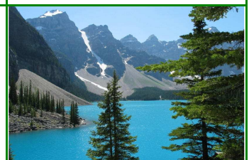
Banff National Park

Banff ist das unbestrittene Zentrum der Kanadischen Rockies. Wir starten mit einer Gondelbahnfahrt auf die Spitze der Canadian Rockies, dem Sulphur Mountain, von wo man eine herrliche Sicht genießt. Kurze Wanderung zum Gipfel. Wir entspannen im warmen Bad in Mineralwassern. Das Nachmittagsprogramm bietet einen Spaziergang entlang von Wasserfällen und den Besuch eines Indianer Museums, wo wir indianische Kultur und Geschichte erleben. Abends gelangen wir nach Calgary. Abschiedsessen in Calgary.