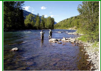
Elk River Lachse

Heute fahren wir nordwärts entlang der Salish Sea nach Campbell River, der „Lachshauptstadt der Welt“. Hier werden riesige Chinook-Wildlache gefischt. Wir sehen uns die Quinsam Salmon Hatchery (falls offen, da in Renovation) an. Auf einer Wanderung entlang des Elk Rivers haben wir Gelegenheit, Lachse im Gewässer und Fischer zu beobachten. Abends erreichen wir mittels einer Fähre Quadra Island, wo wir für 2 Nächte bleiben.