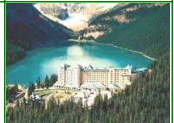
Chateau Lake Louise

Heute erkunden wir den Yoho National Park, das Ort „Field“, das nicht mehr als ein paar Holzgebäude umfasst, und noch das Flair einer Pioniersiedlung aus alten Tagen verströmt. Wir gelangen an den aus der deutsch TV-Serie „Traumschiff“ bekannten Emerald Lake. Wir mieten ein Kanu für eine romantische Bootsfahrt. Danach wandern wir um den türkisfarbenen See. Die Fahrt geht parallel zur historischen Canadian Pacific Railway. Ein Höhepunkt ist die Besichtigung des Chateau Lake Louise am gleichnamigen See. Ein Abstecher bringt uns zum romantischen Moraine Lake, dem wir entlang spazieren. Nacht in Canmore.