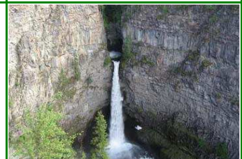
Spahat Wasserfälle Spahat Wasserfälle

Heute bietet sich eine optionale Wildwasserfahrt an auf dem Clearwater River. Im Wells Gray Provincial Park erwarten uns zahlreiche, berühmte Wasserfälle inklusive den Helmcken Falls, den Spahat und Dawson Falls, die wir auf kurzen Spaziergängen erkunden. Mit etwas Glück begegnen wir Bären und anderen Wildtieren.