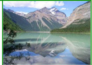
Mt. Robson, Kinney Lake

Unsere Reise führt uns heute in den Mt. Robson Provincial Park, dem Kronjuewel der Rockies, der von der UNESCO zum Weltkulturerbe ernannt wurde. Der Mt. Robson erhebt sich mit 4000 Metern. Wir wandern durch ein wildes Tal bis hinauf zum verträumten Kinney Lake zum Picknick. Die Weiterreise führt nach Jasper, wo wir etwas ausserhalb übernachten.