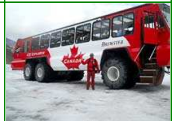
Columbia Ice Explorer

Wir reisen heute auf dem landschaftlich schönen Icefields Parkway in gewaltiger Berggegend voller Gletscher und geniessen verschiedene schöne Aussichtspunkte und Wasserfälle. Beim Columbia Icefield erkunden wir den Athabasca Gletscher auf einem Fussmarsch oder einer optionalen Rundfahrt mit einem Brewster Ice Explorer Bus. Wir fahren durch den Yoho National Park und wandern zu den Takakkaw Wasserfällen. Gemütlicher Ausklang am Abend im kleinen Ort Golden.