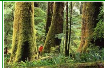
Pacific Rim National Park

Auf einem Tagesausflug gelangen wir auf dem Pacific Rim Hwy an den offenen Pazifik und genießen die atemberaubende Mischung aus Bergen, küstennahen Regenwäldern und Sandstränden bei einer Wanderung im Pacific Rim National Park, einem UNESCO-Biosphärenreservat. In Tofino kann man optional per Boot nach Meares Island fahren. Alternative dazu ist ein Bummel durch das originelle Städtchen Tofino mit seinen schönen Gallerien und guten Kaffees.