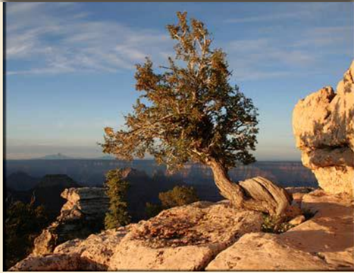
Grand Canyon Sonnenaufgang