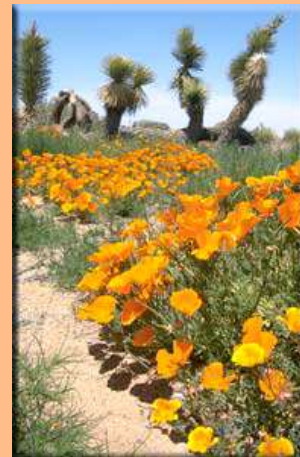
Joshua Tree National Park