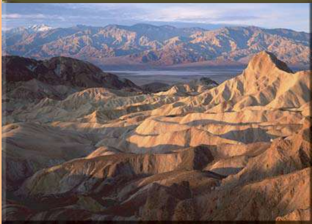
Death Valley National Park, Kalifornien