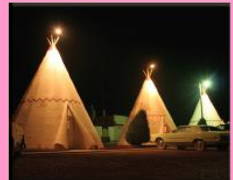
Wigwam Motel, Route 66