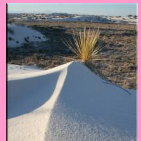
White Sands National Monument