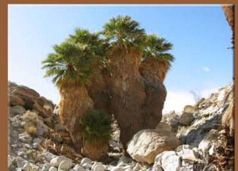
Anza Borrego Desert State Park