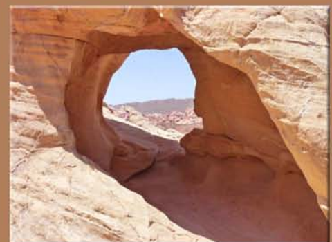
Valley of Fire State Park

Tag 13: Die Wandertour ist heute zu Ende. Heimreise oder individuelle Weiterreise.