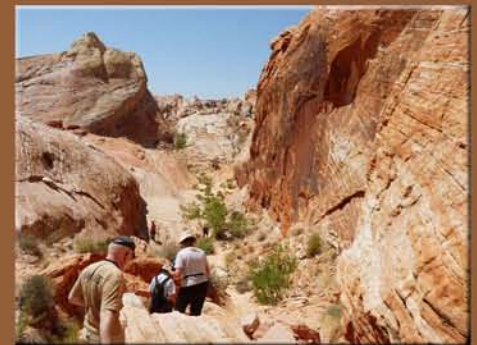
Valley of Fire State Park